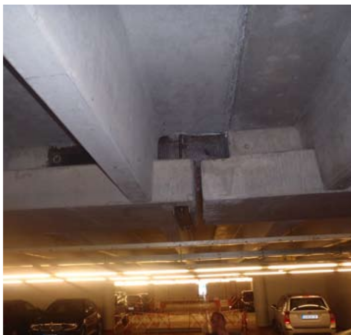
Detail opravy dilatace na tyčových prvcích