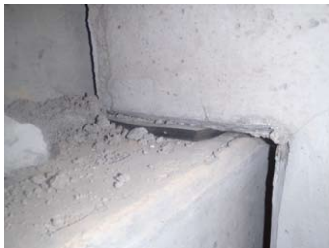
Uložení průvlaků na ozub