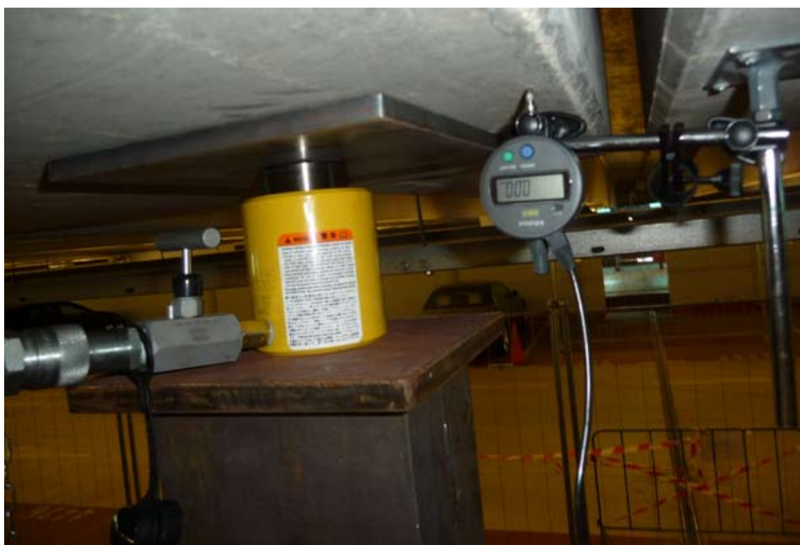
Detail zvedacího zařízení

Samostatně zmíním ještě hydraulické zvedání průvlaků. Přizvednutí průvlaků pro výměnu ložisek provádíme zařízením Enerpac, jedná se, ale o počítačem kontrolovaný zdvih uvnitř provozované budovy s projektantem požadovanou přesností zdvihu 0,1 mm s přesnou kontrolou tlaku v soustavě a dalšími požadavky, kterými Vás nebudu zatěžovat. Podařilo se nám pro tuto zakázku sestavit zařízení s přesností zdvihu a kalibrovaným měřením 0,01 mm, to je ještě 10 x přesnější měření než bylo projektantem požadováno. Měřící zařízení a čidla jsme si vypůjčili ze strojírenského průmyslu a software je Abloc. Při takto přesném měření při aktivaci soustavy je na monitoru vidět jak budova „dýchá,..“ Je zde potenciál využití zařízení na deaktivaci nosníků před aplikací např. uhlíkových lamel na optimální hodnoty nebo různé